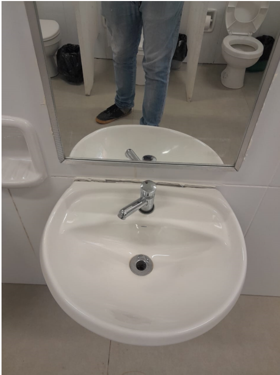
13/02/2025 – Foto 06 – Os lavatórios dos banheiros estão soltos