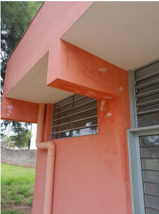
13/02/2025 – Foto 01 – Pontos de infiltração

Tendo em vista o apontamento através da Diretoria da Creche Camila Cristina Nascimento Campos deste município dos problemas encontrados, foi elaborado o referido relatório fotográfico para identificação dos pontos que estão apresentando problemas após a execução da obra através de vistoria in-loco realizada na data de 13/02/2025. Segue fotos abaixo: