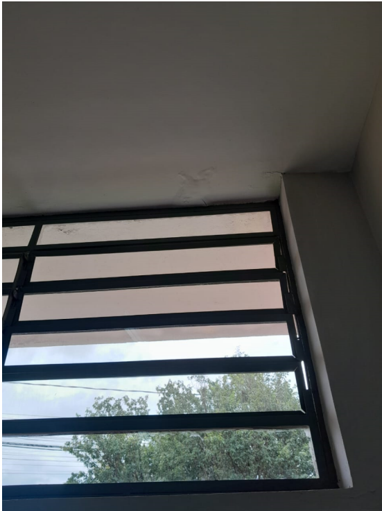
13/02/2025 – Foto 02 – Pontos de infiltração (banheiro)