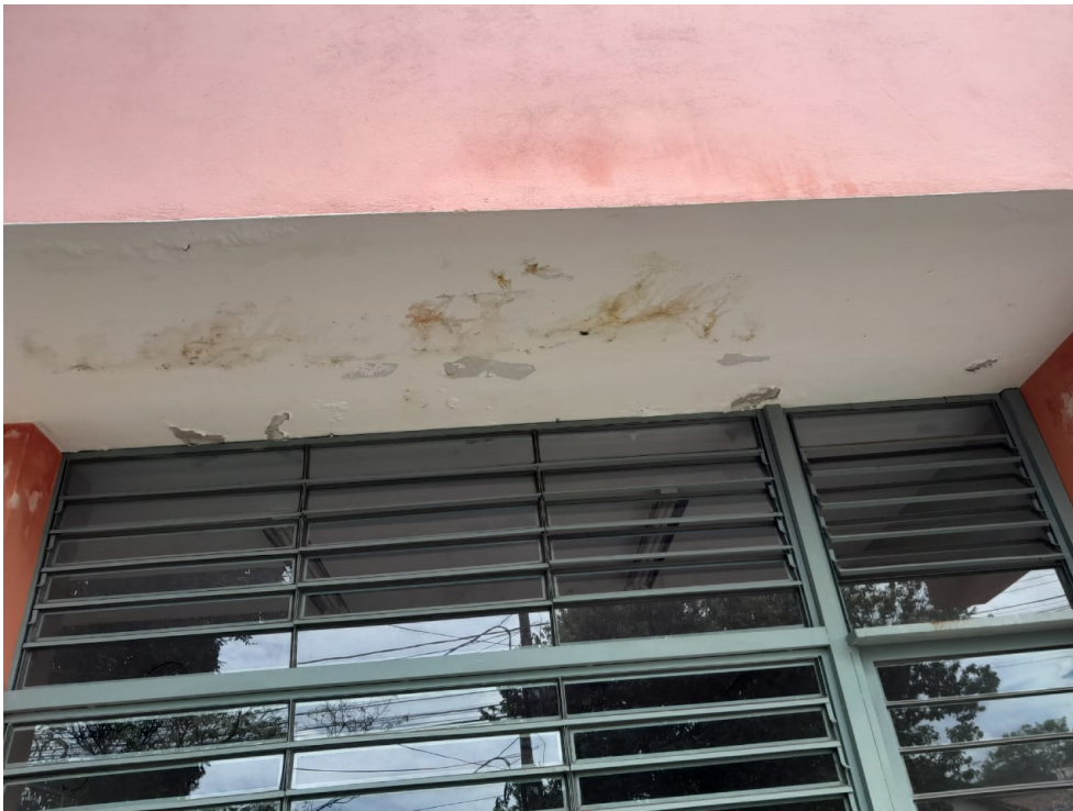
13/02/2025 – Foto 05 – Pontos de infiltração