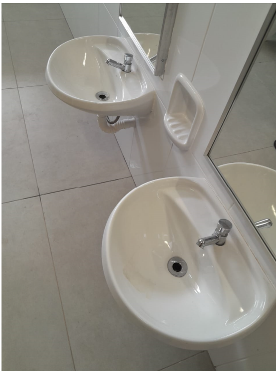
13/02/2025 – Foto 07 – Torneiras estão se soltando das pias dos banheiros