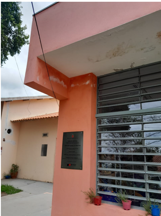
13/02/2025 – Foto 03 – Pontos de infiltração