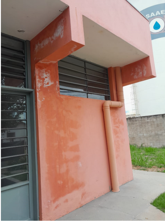
13/02/2025 – Foto 04 – Pontos de infiltração