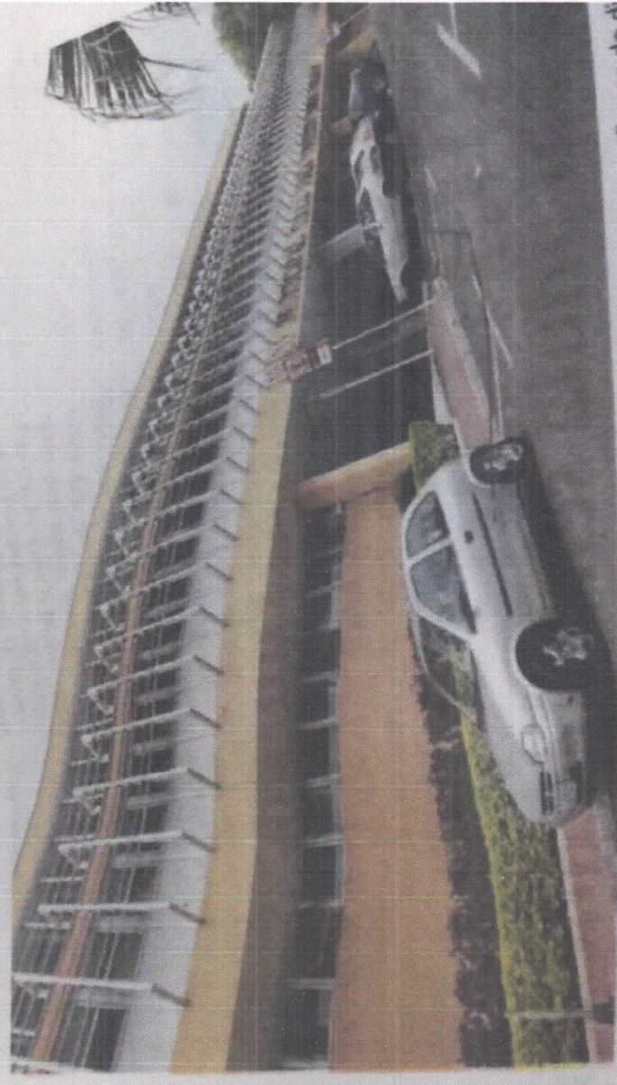
Prefeitura de Jauá anunciou a exoneração de 38 ocupantes de cargos de confiança de d

Em junho, conforme divulgado pelo JC, o MP recomendou que o prefeito Rafael Agostini (PSB) exonerasse em 60 dias todos os comissionados sem curso superior completo. O pedido foi feito nos autos de inquérito civil instaurado para apurar supostas irregularidades envolvendo o preenchimento