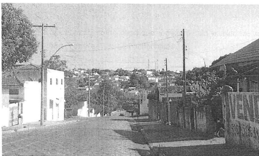
Figura 01 – Declividade começo “baixada”

Conforme ilustram figuras 01 e 02. Em ruas com declividade alta, subentende-se que, o condutor já se encontra obrigado a ter disciplina em todo o percurso.